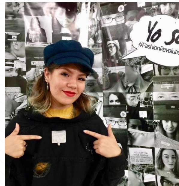
Mercadeo, Logística y Tics