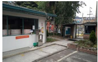
Sede Chuniza (Usme)