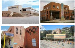
Centros de Desarrollo Comunitario (CDC) 19 Centros en 13 localidades