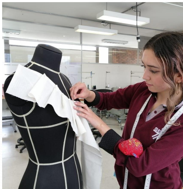
Textil y Confección