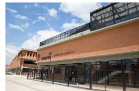
Alianza Colegio De La Bici (IED)