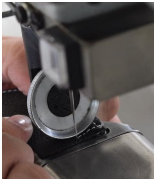
Cuero, Calzado y Marroquinería